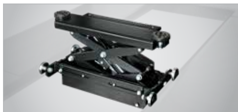
SOLLEVATORE AUSILIARIO PER QUATTROLIFT