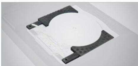
KIT SPessori PER PIATTI GIREVOLI PREMIUM