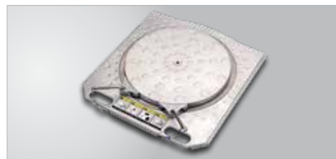
KIT PIATTI GIREVOLI PREMIUM