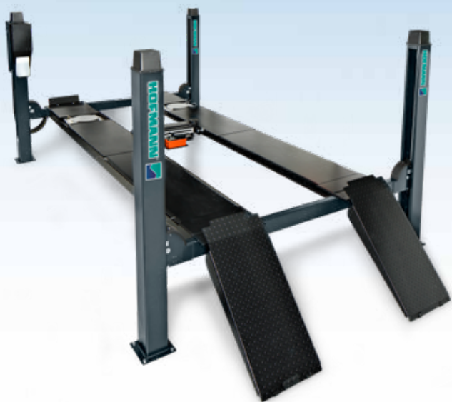
geoliner® 630 TILT

Contattate il vostro rappresentante e scoprite la combinazione migliore, con il vostro assetto ruote e piatti girevoli Hofmann® in un pacchetto unico